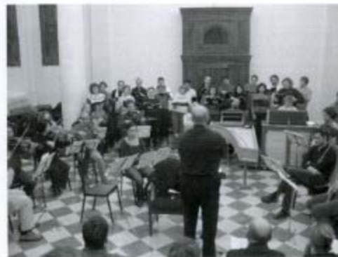
Letture dei testi e Prove nell'Oratorio di S. Filippo Neri, Vicenza