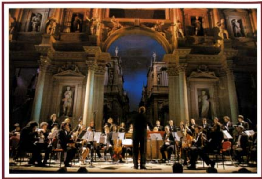
Concerto nel Teatro Olimpico di Vicenza, 20 ottobre 2004